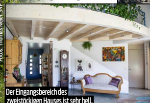
Der Eingangsbereich des zweistöckigen Hauses ist sehr hell.