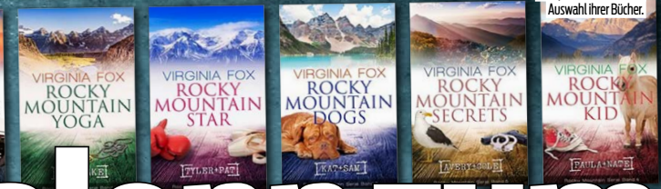
Die Zürcher Autorin ist sehr produktiv. Hier eine Auswahl ihrer Bücher.